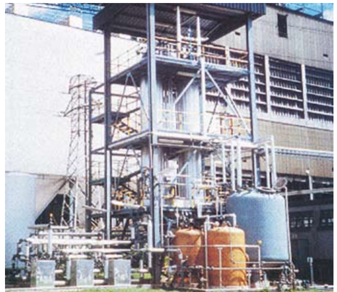
LOPROX®-Anlage, La Felguera, Spanien