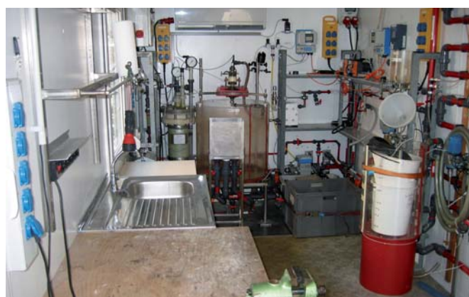
Mobiler Versuchscontainer für Pilotierungsversuche vor Ort