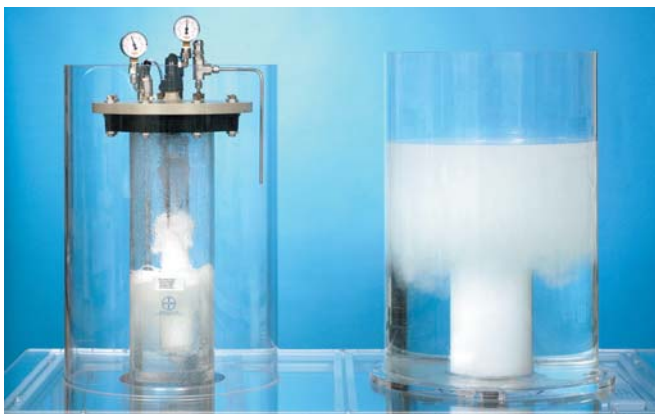
Versuchsanlage zur Druckaufsättigung und Beurteilung des Blasenspektrums

BayFlotech® wird zur Abtrennung von suspendierten Feststoffen aus Prozess- und Abwasser eingesetzt. Ihre besondere Effizienz zeigt die Anlage in den typischen Anwendungsgebieten der Druckentspannungsflotation (DAF). Die als Package-unit konzipierten Anlagen für einen Durchfluss von 100 bis über 1000 m 3 /h können, falls nötig, auch an ihre speziellen Prozessbedingungen angepasst werden.