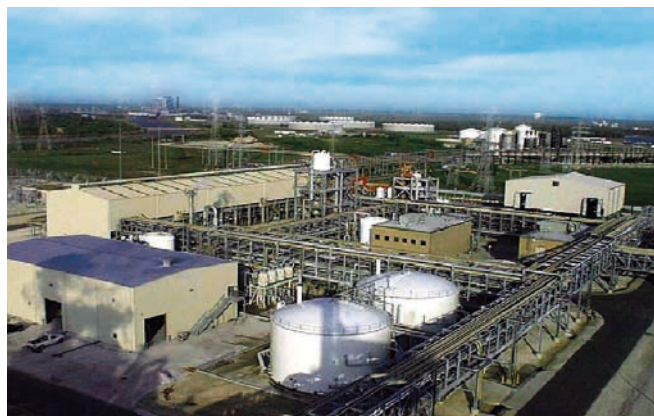
Установка электролиза хлора, Бейтаун (США)

Наряду с этим компания Bayer Technology Services успешно занимается сбытом производственных агрегатов и компонентов. В 2004 году мы заключили контракты на поставку оборудования для транспортировки и хранения соли, а также нескольких систем для сушки хлора. Наш пакет услуг охватывает проектирование, поставку главных компонентов оборудования, надзор за монтажом и поддержку в ходе пуска-наладки.