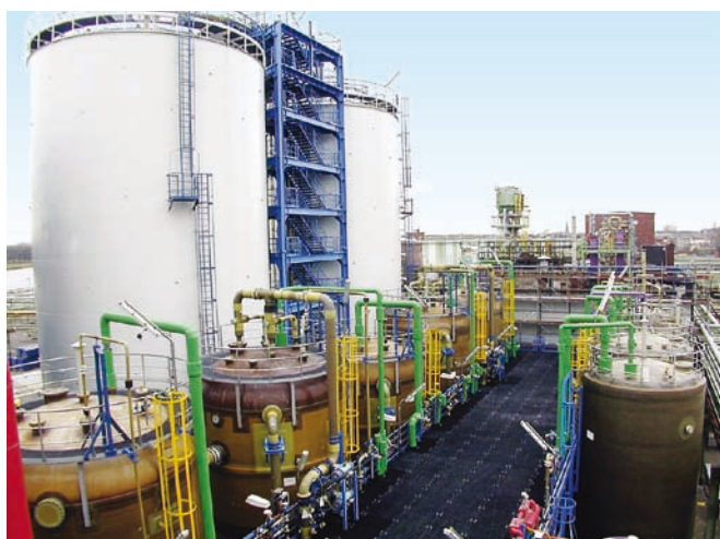
Хранение соли и обработка рассола, Дормаген (Германия)

Благодаря реализации целого ряда проектов по конверсии предприятий, компания Bayer Technology Services располагает необходимым опытом для разработки концепций, которые позволят Вам организовать бесперебойные поставки хлора даже в сложных условиях. В этой работе мы применим и наши знания, полученные в ходе сотрудничества с разными производителями электролитических ванн.