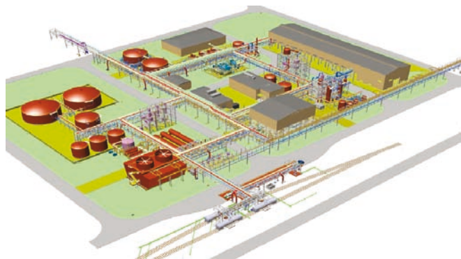
Трехмерная модель установки электролиза хлора

Опираясь на накопленный опыт, компания Bayer Technology Services предлагает услуги с учетом индивидуальных потребностей Заказчиков по возведению новых предприятий, расширению и модернизации существующих установок. Мы проводим проектирование не только цехов электролиза, но и других технологических участков, а также оптимизацию процесса электролиза хлора по технологии Bayer Technology Services. Кроме того, мы являемся надежным партнером в деле оценки рентабельности и безопасности производства.