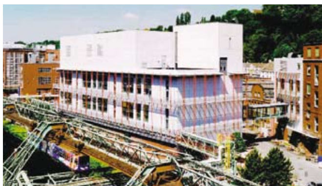
Пилотная фабрика „Pharma Development“, Вупперталь (Германия), 2002 г.

Мы проводим реализацию комплексных проектов во всем мире во всех классах стандартов GMP, включая: