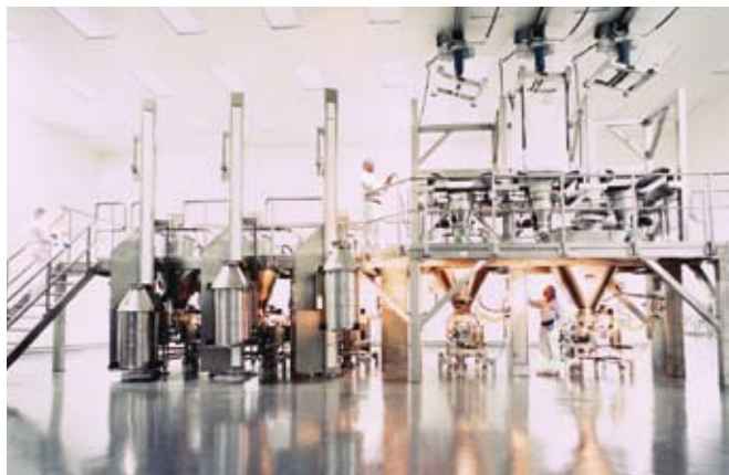
Фабрика твердых лекарств, Майерстаун (США), 2002 г.