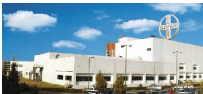
Расширение фабрики твердых лекарств, Лерма (Мексика), 2002 г.