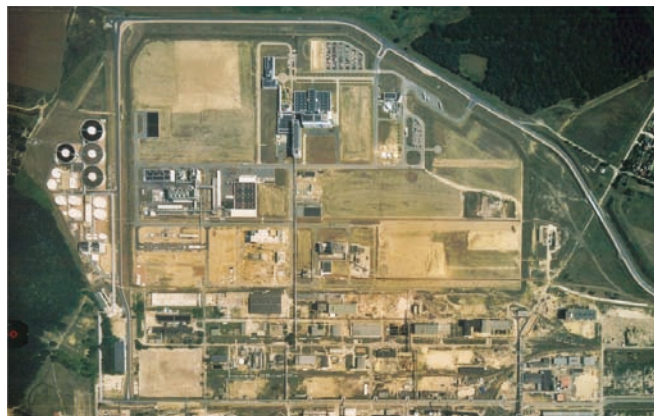
Аэрофотосъемка Индустриального парка Bayer Bitterfeld

В наших проектах мы учитываем, кроме того, влияние на региональное окружение и привязку к нему, а также внешнюю инфраструктуру. Вопросы безопасности и охраны окружающей среды в отношениях между заводом и прилегающими территориями, конечно же, являются составной частью наших генеральных планов площадок размещения предприятий.