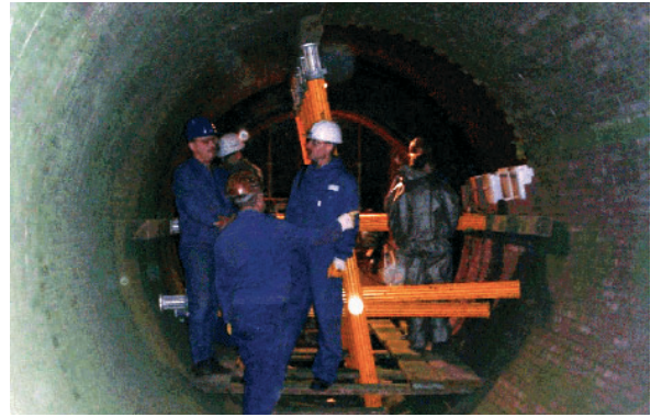
Feuerfeste Ausmauerung eines Drehrohrofens, gespindelt