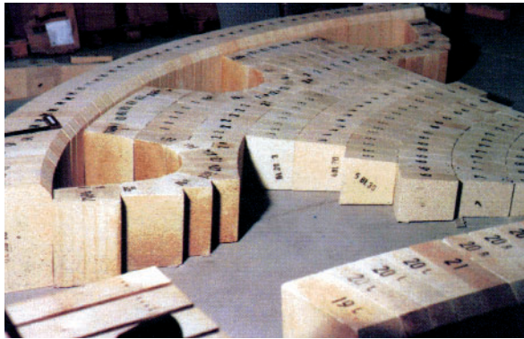
Vorbereitung der Auskleidungsarbeiten einer Klärschlammverbrennungsanlage