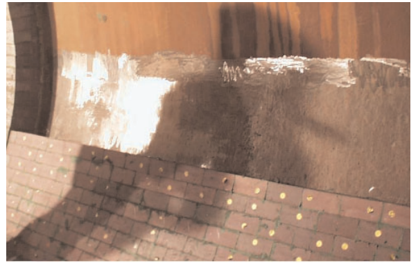
Feuerfeste Auskleidung des Drehrohrofens einer Sondermüllverbrennungsanlage